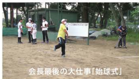
会長最後の大事な「始球式」